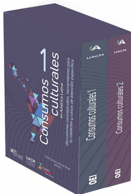
Imagen: Conjunto de 2 tomos de Consumos Culturales

Redacción del Observatorio de Políticas y Economía de la Cultura a partir de extractos del prólogo y de la introducción de la obra