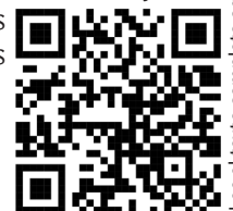
Lee el texto completo aquí

Ante este fenómeno, la educación en artes musicales podría presentarse como una ruta de escape de la dinámica de mercado que reduce las sensibilidades. Porque si lo analizamos, no solo es necesario que los profesionales de la música conzocan el medio laboral en el que se insertan o incluso las asignaturas escolares que preparan a las futuras audiencias para una escucha más crítica de la música, si no que se requieren profesionales de la música que contribuyan a cambiar las reglas del juego para sus colegas [...]