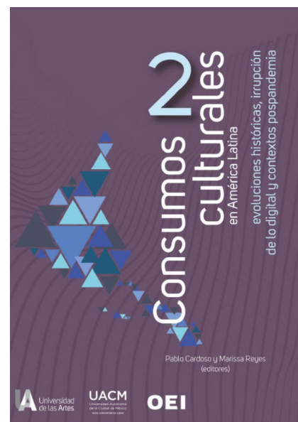
Imagen: Tomo II de Consumos Culturales